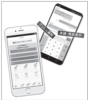
■図1■「CROSS TALK for STAFF」 自社アプリとして発信できる

ダウンロードして使う「CROSS TALK for STAFF」もリリースされており、こちらを使うと（併用で基本料金は月5万円）、コミュニケーション精度をさらに高めることができる。「プッシュ通知」で閲覧率を高め「未読・既読表示」をアプリと同時に管理画面に表示させることができる。このアプリ、実は、派遣会社の事情を知り尽くした開発元ならではの工夫がある。「派遣会社の自社専用アプリ」として提供できるのだ（図1）。つまりスタッフが、派遣会社の社名や独自のアプリ名で検索しダウンロードするため、社名の認知度が高まる。スタッフとのコミュニケーションを大切にしている姿勢も伝わり、信頼感が生まれてブランディングにも繋がるといふわけだ。